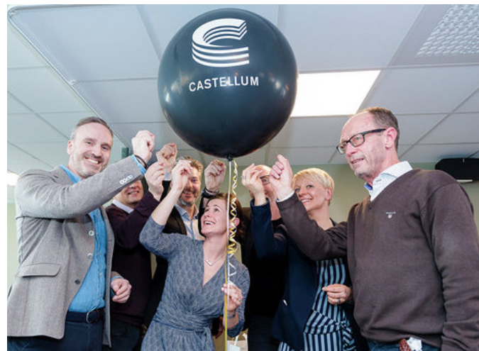
Höga smällar på Castellums invigning av kv Tullen.

Tillbyggnaden av kv Tullen i Växjö är nu invigd. Ett svårt projekt med grundläggning rakt igenom befintlig källare och med hyresgäster och grannar alldeles inpå.