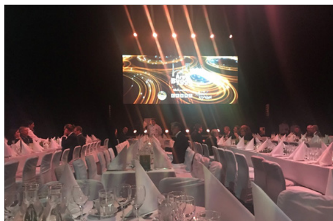
Pampig gala på Cirkus i Stockholm när Årets bygge utsågs.