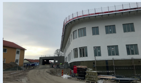
t.v Armeringsarbeten i full gång på Kungsljuset i Kalmar t.h Vuxenpsyki i Växjö - snart dags för taklagsfest

Heimstaden är nöjda med första huset som vi har byggt om på Kv. Idet i Växjö och har nu beställt 4 ytterligare, med ambitionen att vi ska bygga alla 14.